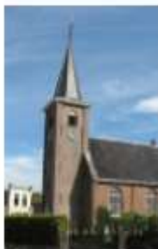
Toren Hervormde Kerk 35843 Ds. Offerhausweg 1 9264 TH Earmewâld