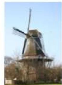
Korenmolen De Hoop 35883 Mounepad 21 9262 NE Sumar