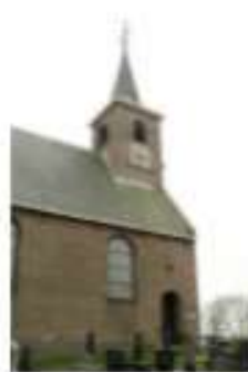
Toren Hervormde Kerk 35877 Slachtedijk 1 9254 HE Ryptsjerk