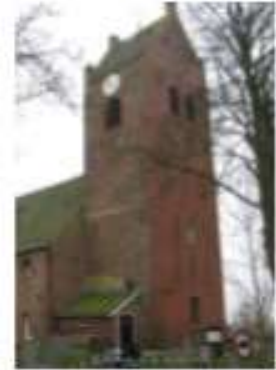
Toren Mariakerk 35858 Wijnserdijk 9 9062 GP Oentsjerk