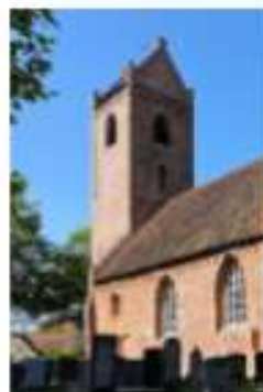
Toren St. Petruskerk 35845 Schoolstraat 2 9251 EC Jistrum