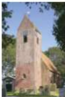
Toren St. Vituskerk 35890 Wyns 31 9091 BE Wyns