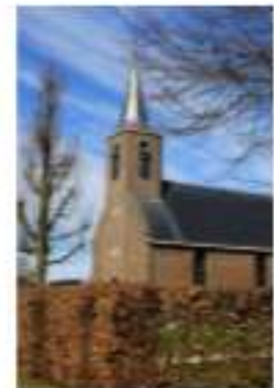
Toren Hervormde Kerk 35880 Greate Buorren 14 9262 SB Sumar