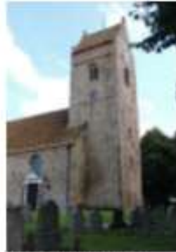
Toren Pauluskerk 35869 Van Sminaweg 9 9064 KD Aldtsjerk