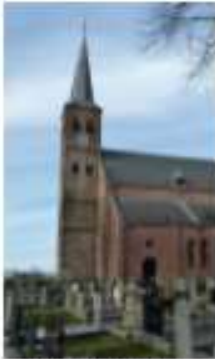
Toren Kruiskerk 35834 Nieuwstad 5 9251 LM Burgum