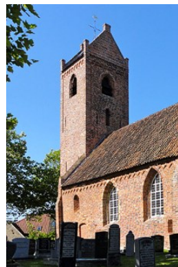
Toren St. Petruskerk 35645 Schoolstraat 2 9251 EC Jistrum