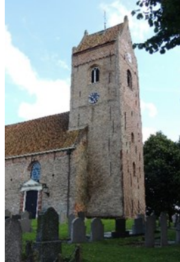
Toren Pauluskerk 35669 Van Sminiaweg 9 9064 KD Aldtsjerk