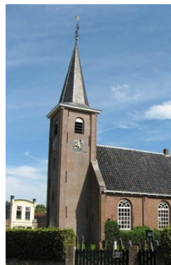
Toren Hervormde Kerk 35643 Ds. Offerhausweg 1 9264 TH Earnewâld