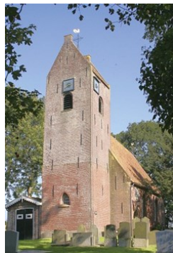
Toren St. Vituskerk 35690 Wyns 31 9091 BE Wyns