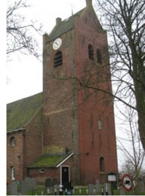
Toren Mariakerk 35658 Wijnserdijk 9 9062 GP Oentsjerk