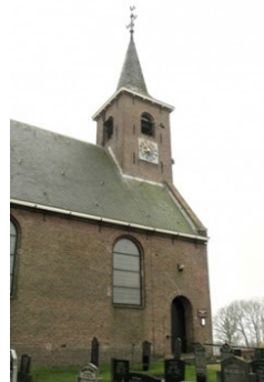
Toren Hervormde Kerk 35677 Slachtedijk 1 9254 HE Ryptsjerk