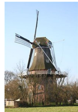
Korenmolen De Hoop 35683 Mounepad 21 9262 NE Sumar