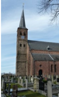
Toren Kruiskerk 35634 Nieuwstad 5 9251 LM Burgum