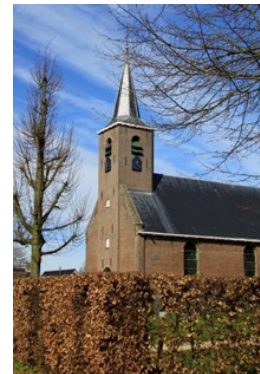
Toren Hervormde Kerk 35680 Greate Buorren 14 9262 SB Sumar